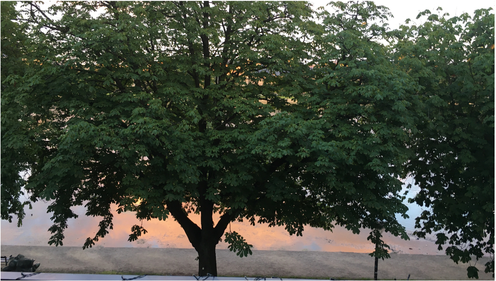
Morgensol på Dosseringen

Der var mange besøg i Asserbo og ture ind til Ella samt familieture i ZOO og i Sagnlandet Lejre.